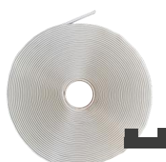
Bande Butyl U