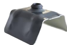
Cavalier + néoprène