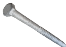
Tirefond à visser